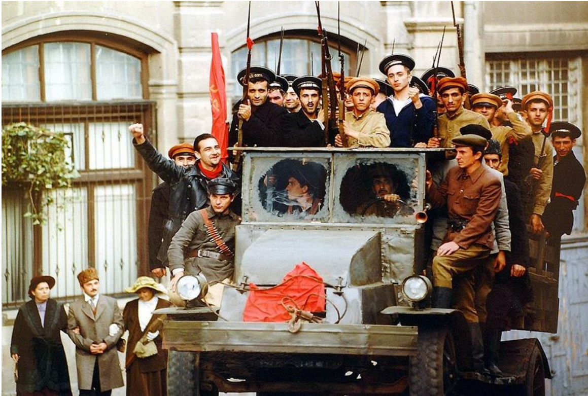
Kadr z filmu Przedwiośnie w reż. Filipa Bajona.

Jaki okres życia Cezarego Baryki przedstawia poniższy kadr z filmu Filipa Bajona Przedwiośnie ? Zaznacz właściwą odpowiedź oraz ją uzasadnij, odwołując się do przedstawionej na fotografii sytuacji i wydarzeń z Przedwiośnia Stefana Żeromskiego.