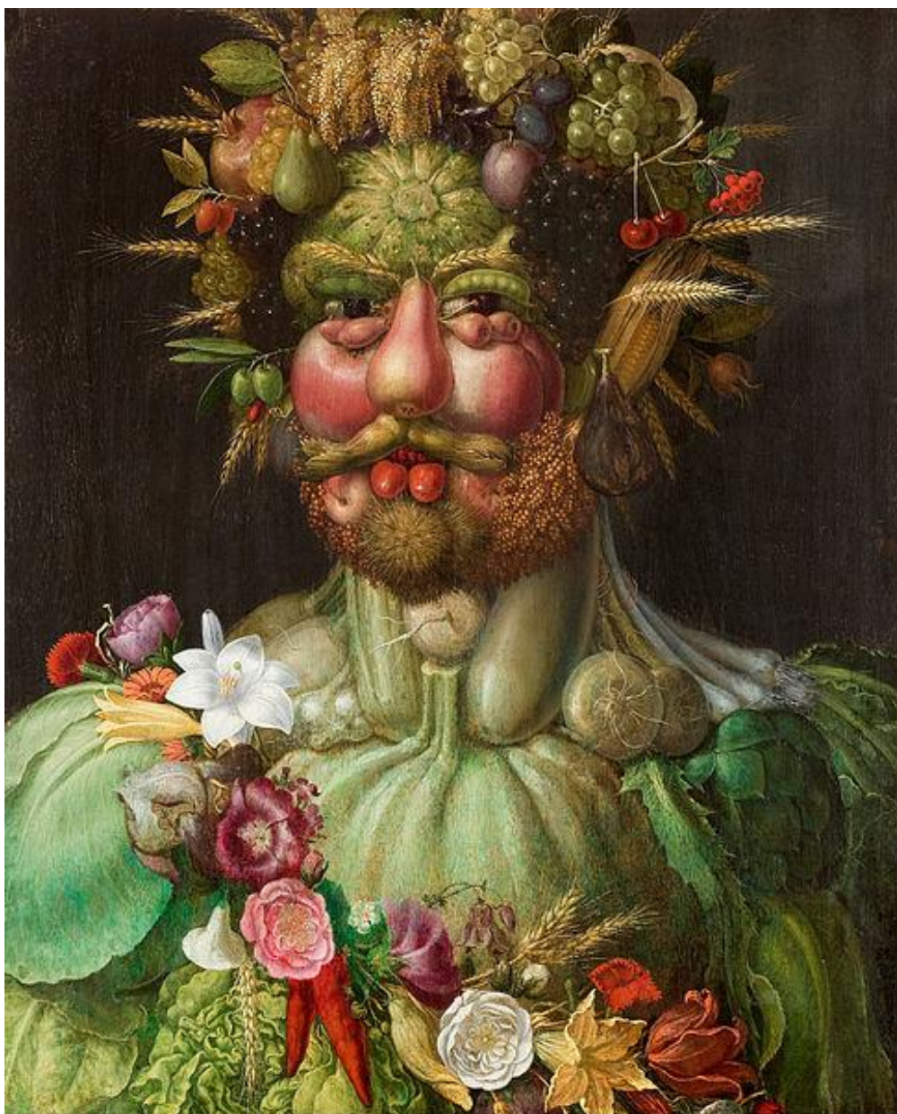
Giuseppe Arcimboldo, Rudolf II Habsburg jako Wertumnus 1 , 1591, olej na desce, 70 x 58, Skokloster w Szwecji; pl.m.wikipedia.org .