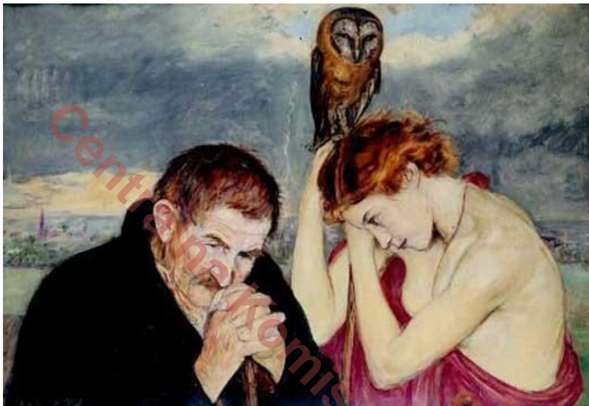
Wlastimil Hofman, Starość i młodość , www.muzeumsecesji.pl

Obejrzyj reprodukcję obrazu Starość i młodość Wlastimila Hofmana.