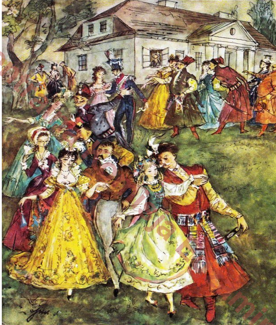
Jan Marcin Szancer, ilustracja do księgi XII Pana Tadeusza

Zapoznaj się z załączoną ilustracją Jana Marcina Szancera do Pana Tadeusza Adama Mickiewicza , która przedstawia Zosię i innych bohaterów utworu w scenie poloneza opisanego w księdze XII.